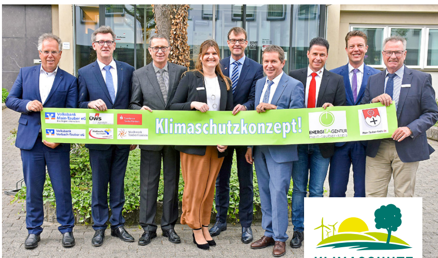
Die Projektpartner der Klimaschutzinitiative

Informationsveranstaltung am 12. März 2020